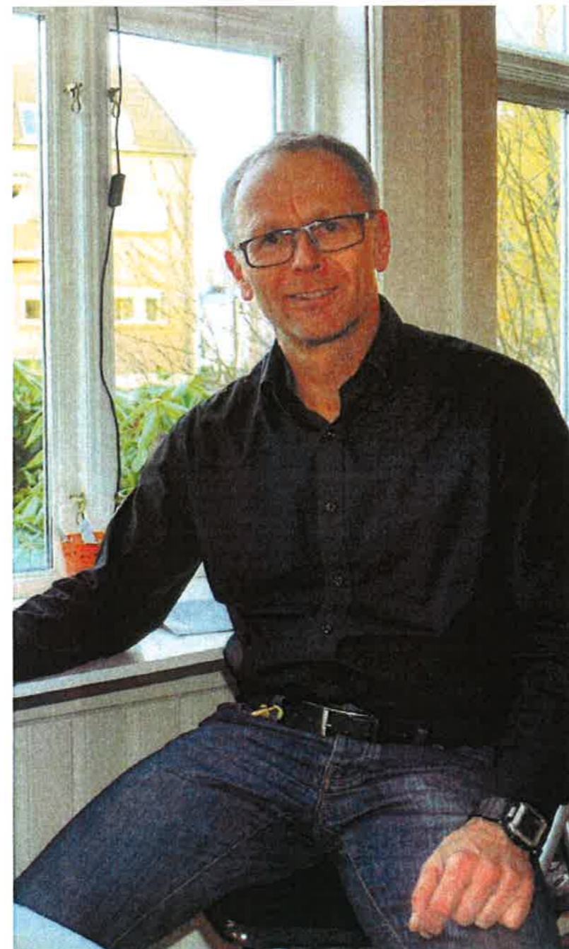
konstruktive ideer om hva som skaper god oppvekst.