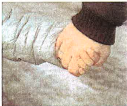
SAMMEN OM OPPVEKST: Langsiktig, forpliktende satsing må til.